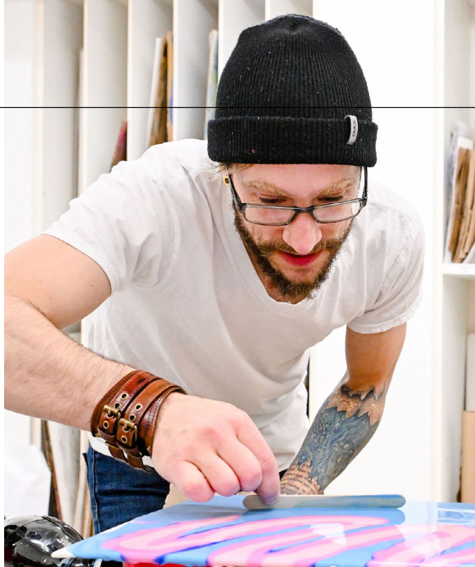
Centre des arts de Dollard