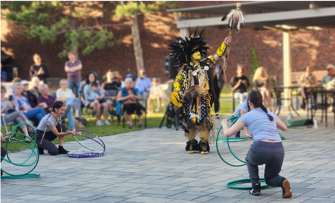
Ma nature urbaine de A'nó:wara Dance Theatre, juin 2024

La Ville est membre de l'Association des diffuseurs culturels de l'Île de Montréal (ADICIM). Ensemble, et particulièrement avec les villes limitrophes, les membres veillent à ne pas se faire concurrence dans la programmation