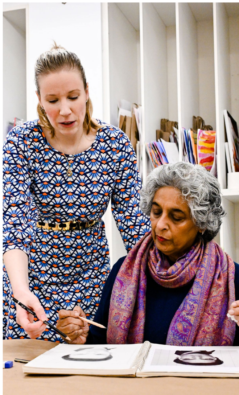
Centre des arts de Dollard

Les responsables culture et loisirs de la Ville se sont fait accompagner par l'équipe d'ArtExpert pour franchir toutes les étapes du processus rigoureux qui a mené à cette première politique culturelle. Ce processus a d'abord permis d'établir le portrait sociodémographique de la population et de faire l'inventaire de l'offre culturelle actuelle. Cette première étape a ensuite permis de tracer un diagnostic et d'identifier les enjeux et les défis propres à Dollard-des-Ormeaux. Un exercice de consultation publique auprès du milieu et de la population a ensuite enrichi ce diagnostic et permis de mettre les bases des actions souhaitées pour structurer et améliorer l'offre culturelle. Un comité de suivi , composé de parties prenantes actives dans le milieu culturel, a veillé attentivement au bon déroulement du processus. Les divers échanges avec le comité ont permis de rester à l'affût des réalités propres à Dollard-des-Ormeaux et d'ajuster la vision du déploiement futur de l'offre culturelle.