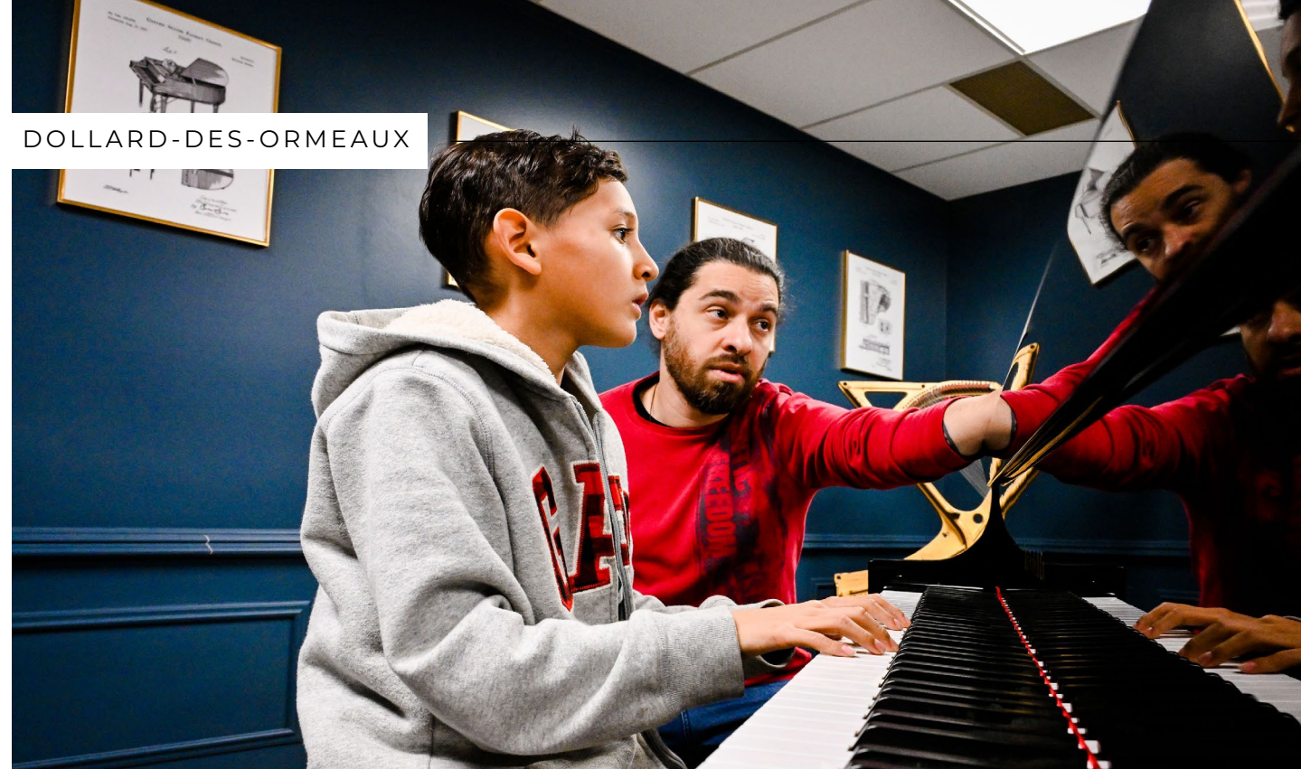
Centre des arts de Dollard