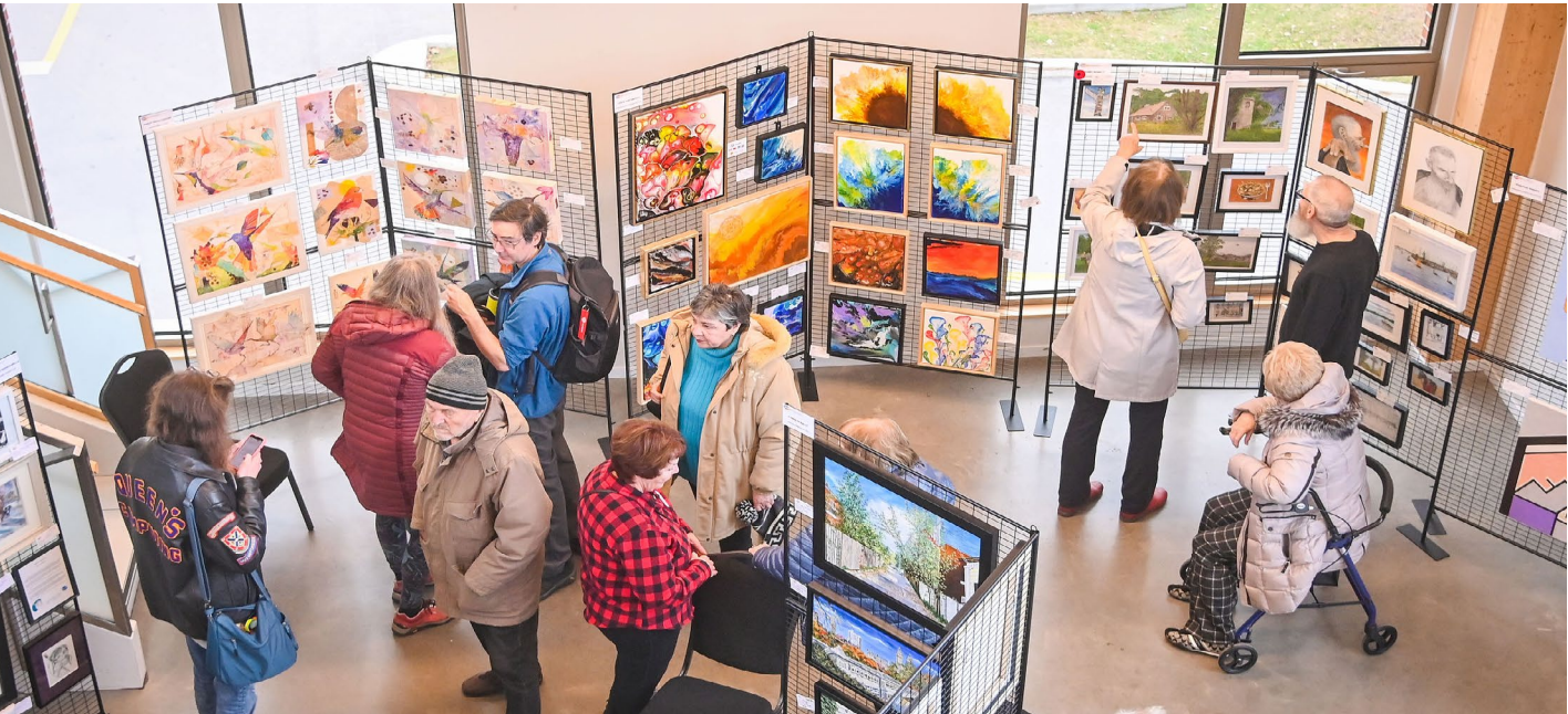
Exposition d'art de l'Association des artistes de Dollard

La programmation culturelle riche et variée de la Ville comprend une série d'activités telles que des spectacles, des ateliers et des conférences. En complément de son programme principal, l'offre culturelle s'enrichit d'une dimension communautaire et récréative, proposant une série d'activités variées et accessibles à tous. Les visiteurs peuvent ainsi découvrir des expositions à la bibliothèque, participer à des Rendez-vous littéraires ou profiter de la lecture en plein air avec Biblio au parc et la Biblio mobile .