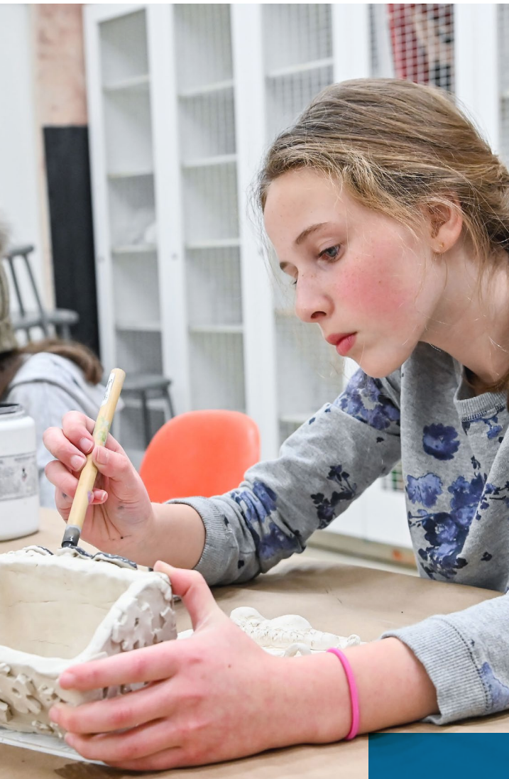
Centre des arts de Dollard

Le rôle des municipalités est de créer des environnements favorables à l'amélioration de la qualité de vie, à l'émergence de richesse et à l'établissement d'un équilibre social permettant à chaque individu de s'épanouir dans le milieu où il a choisi de vivre. Les initiatives culturelles, de loisirs et un milieu communautaire actif participent au développement des collectivités 3 .