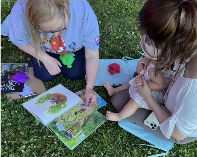
Biblio au parc