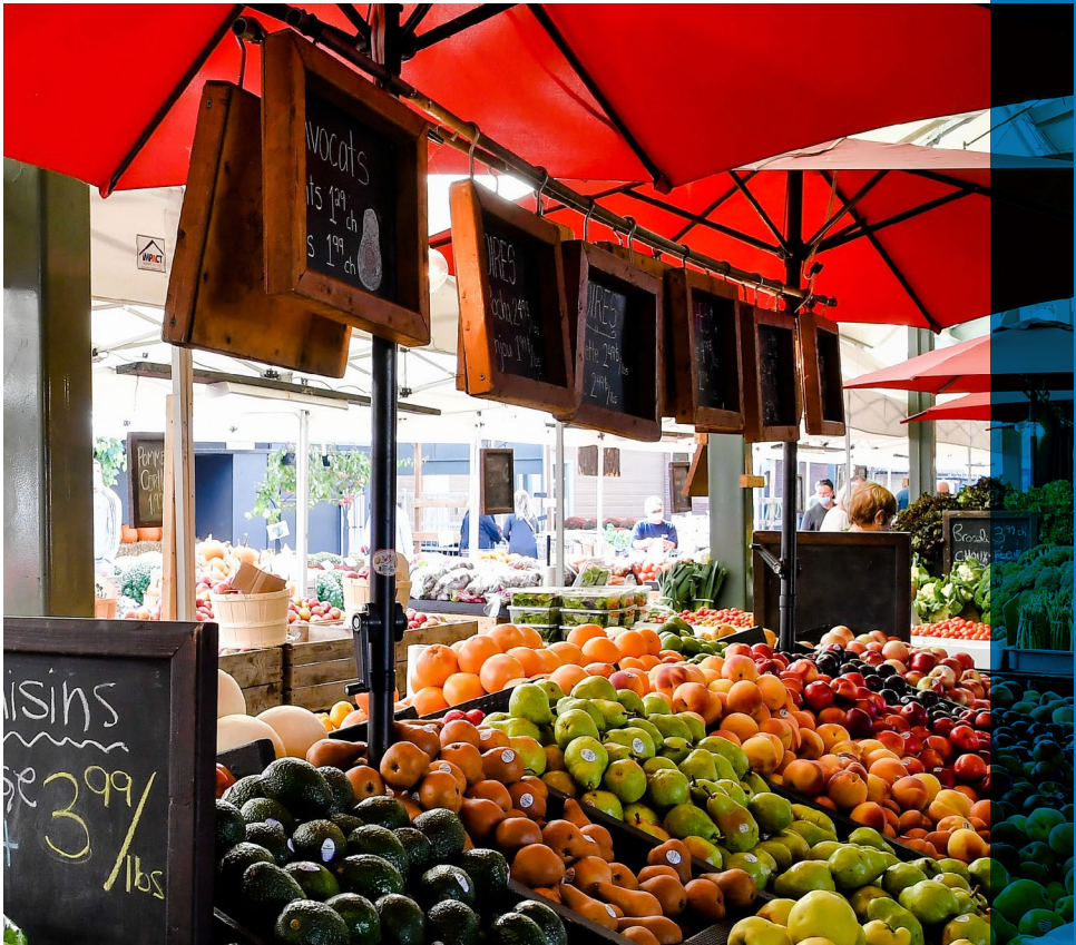
Marché de l'Ouest

La Déclaration de Mexico de 1982 sur les politiques culturelles de l'UNESCO définit la culture comme l'ensemble des traits spirituels, matériels, intellectuels et affectifs qui caractérisent une société. Elle englobe les arts, le mode de vie, les droits de l'homme, les systèmes de valeurs, les traditions et les croyances. La culture façonne les individus et les sociétés, en favorisant l'unité par le biais de valeurs et de traditions partagées.