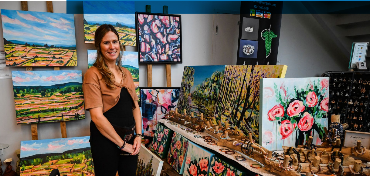
Marché d'art et d'artisanat