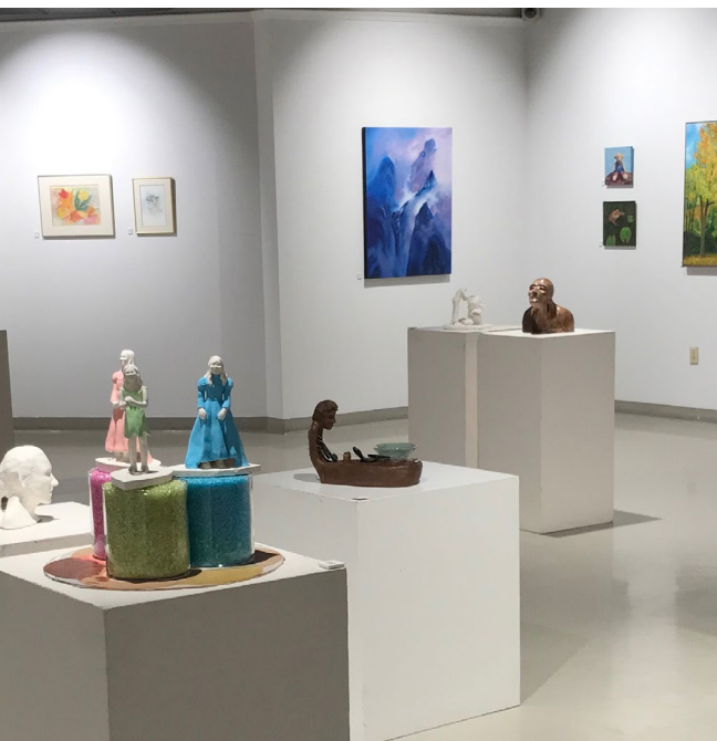
Galerie d'art de la Ville