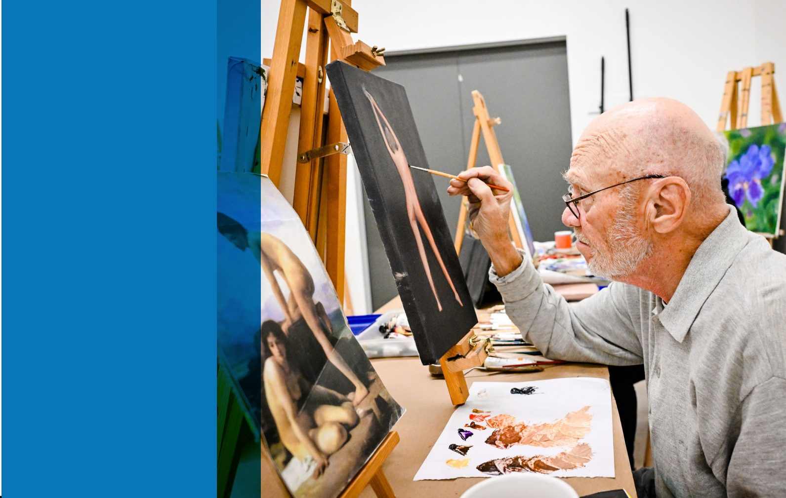
Centre des arts de Dollard