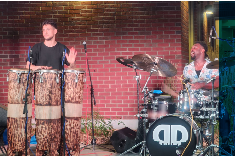
Coubli de Donald Dogbo, août 2024

La Ville est membre de l'Association des diffuseurs culturels de l'Île de Montréal (ADICIM). Ensemble, et particulièrement avec les villes limitrophes, les membres veillent à ne pas se faire concurrence dans la programmation